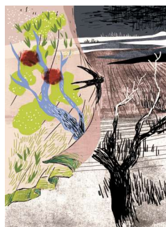
Omslaget: illustration af Katrine Clante fra Den store ordsprogsbog, Gyldendal 2016